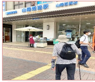
バスで姫路駅まで