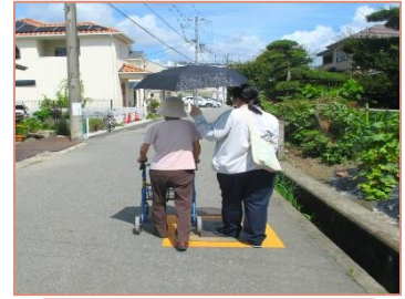
公民館まで屋外歩行